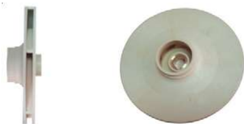
schéma Turbines cylindriques épaulée